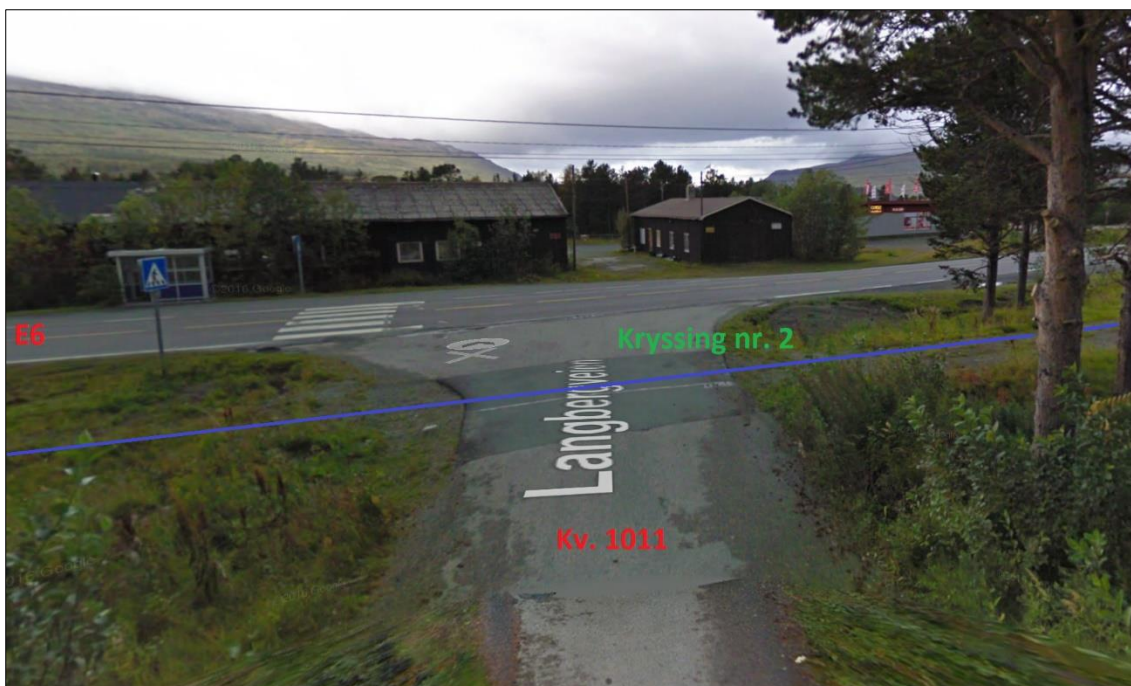
Figur 2: Illustrasjon fra google street view, kryssing kv. 1011